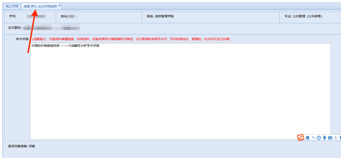
(上图为“查看硕士生论文评阅信息”界面)